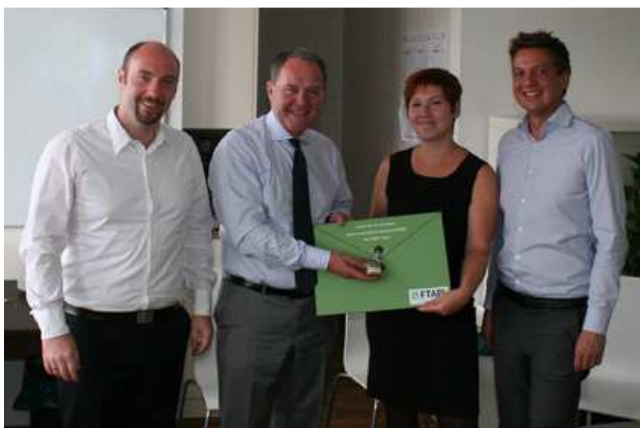
BU: Zum Abschied erhielt Herr Dr. Heubisch einen FTAPI-Account für den sicheren und einfachen Versand von Dateien. Dateiname: Besuch_Heubisch_3.jpg

Minister Heubisch dazu: „Leider haben viele großen Respekt vor der Verschlüsselung, die oft sehr komplex ist. Dabei muss heute im Grunde jeder damit rechnen, dass er gehackt wird. Deshalb ist der verschlüsselte Austausch von Daten so wichtig.“